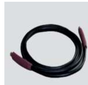
hadica 3,70m a 5,50m